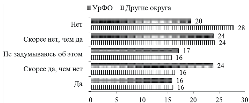
Рис. 3. Отношение к желанию жить за пределами Российской Федерации, % ответивших, пропуски 3,3%

Молодые люди в большинстве своем придерживаются традиционных ценностей, однако показатели степени приверженности к эмиграционным настроениям вызывают озабоченность. Каждый шестой однозначно и более трети респондентов в разной степени положительно продемонстрировали желание проживать за границей. Разница между уральской и остальной российской мо-