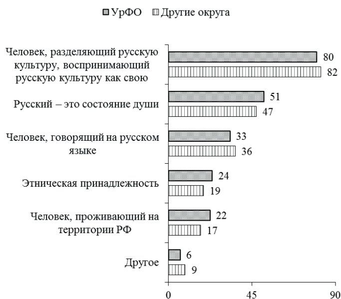
Рис. 1. Идентификация с понятием «русский», поливариантный вопрос, % опрошенных, пропуски 3,3%

Как мы видим, для молодого поколения «русский человек» — это не наследственная характеристика, а прежде всего сознательное приобщение и разделение культурно-исторических ценностей народа. Обратим внимание, что ряд респондентов в открытом варианте ответа фактически описали все предложенные характеристики, отмечая, что человек, душой и сердцем разделяющий ценности народа, не будет жить за пределами той страны, где этот народ проживает.