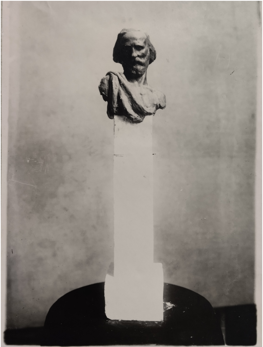
Рис. 1. ЦГАКФФД СПб. Гр. 40663. Проект памятника Джузеппе Гарибальди. 1918 г. Петроград. Автор съемки Я. В. Штейнберг