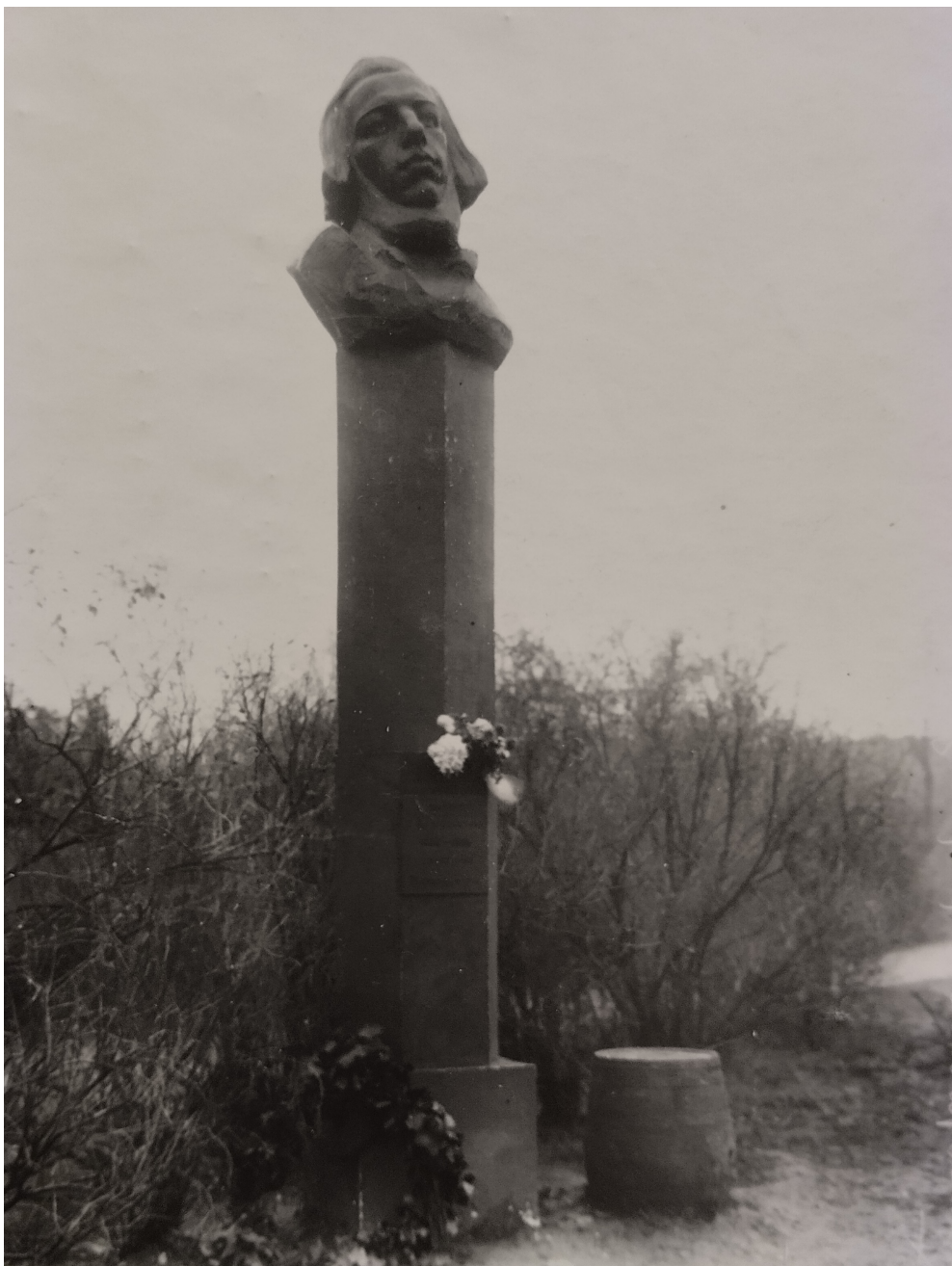
Рис. 2. ЦГАКФФД СПб. Др. 9588. Памятник писателю Н. А. Добролюбову (скульптор К. Зале) у Тучкова моста. 1919 г. Петроград. Автор съемки Я. В. Штейнберг