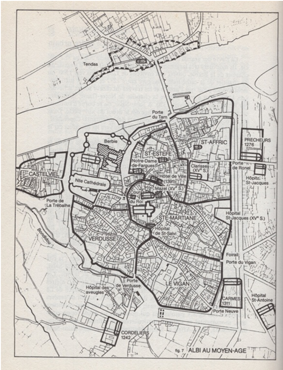
Рис. 2. Альби в Средние века [Biget, 1983]

Проведенный анализ позволил также выявить, что такие пункты, как замок Турия и Памплона, упоминаются почти исключительно лишь в случае с их осадой в 1380–1381 гг., до этого никаких связей между ними и Альби не зафиксировано. Это может свидетельствовать об их малом значении для жителей Альби (рис. 2).