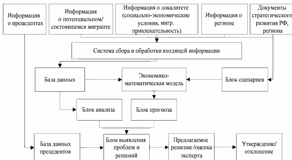
Рис. 2. Концептуальная схема системы управления региональным развитием