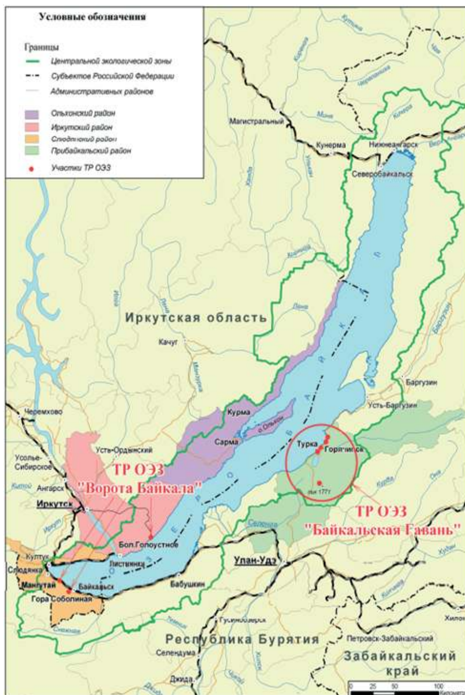
Рис. 1. Центральная экологическая зона вокруг Байкала