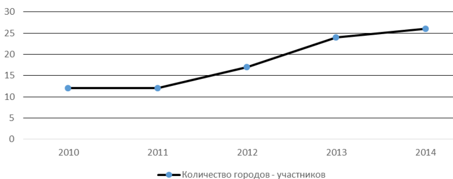
Рис. 1. Показатели динамики роста количества городов-участников фестиваля