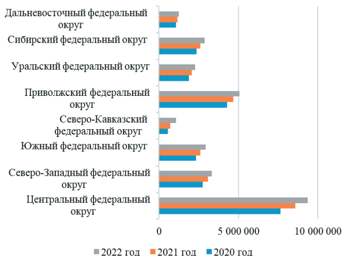
Рис. 5. Динамика численности занятых в сфере малого и среднего предпринимательства, включая индивидуальных предпринимателей, в разрезе федеральных округов

В заключение проанализируем динамику численности занятых в секторе МСП, включая индивидуальных предпринимателей, в разрезе федеральных округов (рис. 5).