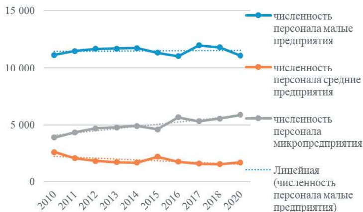
Рис. 4. Динамика численности персонала, занятого в субъектах малого и среднего предпринимательства Fig. 4. Dynamics of the number of personnel employed in small and medium-sized businesses

Рис. 4 демонстрирует динамику численности занятых в секторе малого и среднего предпринимательства.