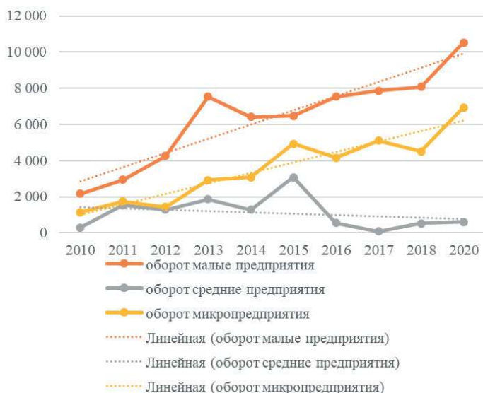
Рис. 3. Динамика оборота субъектов малого и среднего предпринимательства Fig. 3. Dynamics of turnover of small and medium-sized businesses

Рост оборота субъектов малого предпринимательства может демонстрировать, что субъекты хозяйствования развиваются и повышают свою экономическую активность. Это может быть связано как с ростом величины спроса на товары и услуги, которые они поставляют, так и с улучшением условий для ведения бизнеса в целом.