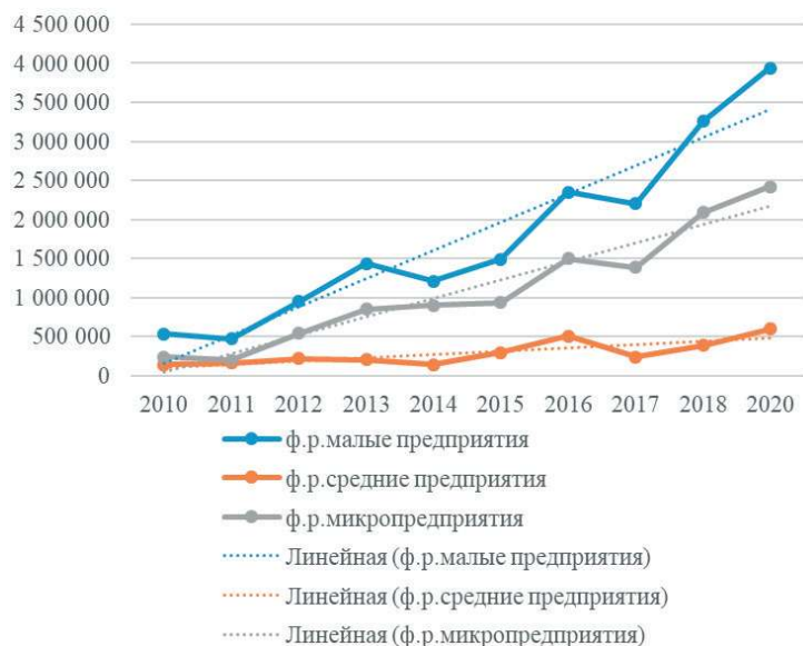
Рис. 2. Динамика величины финансового результата, сформированного субъектами малого и среднего предпринимательства

На рис. 2 представлена динамика величины финансового результата, сформированного субъектами малого и среднего предпринимательства.