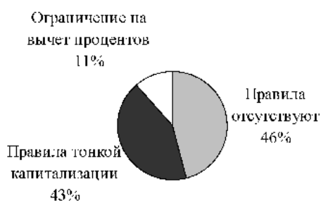
Рис. 1. Распределение стран по применению инструментов противодействия замещению собственного капитала заемным для целей налогообложения

Результаты распределения стран, включенных в исследование, по применению описанных инструментов противодействия замещению собственного капитала заемным для целей налогообложения представлены на рис. 1.