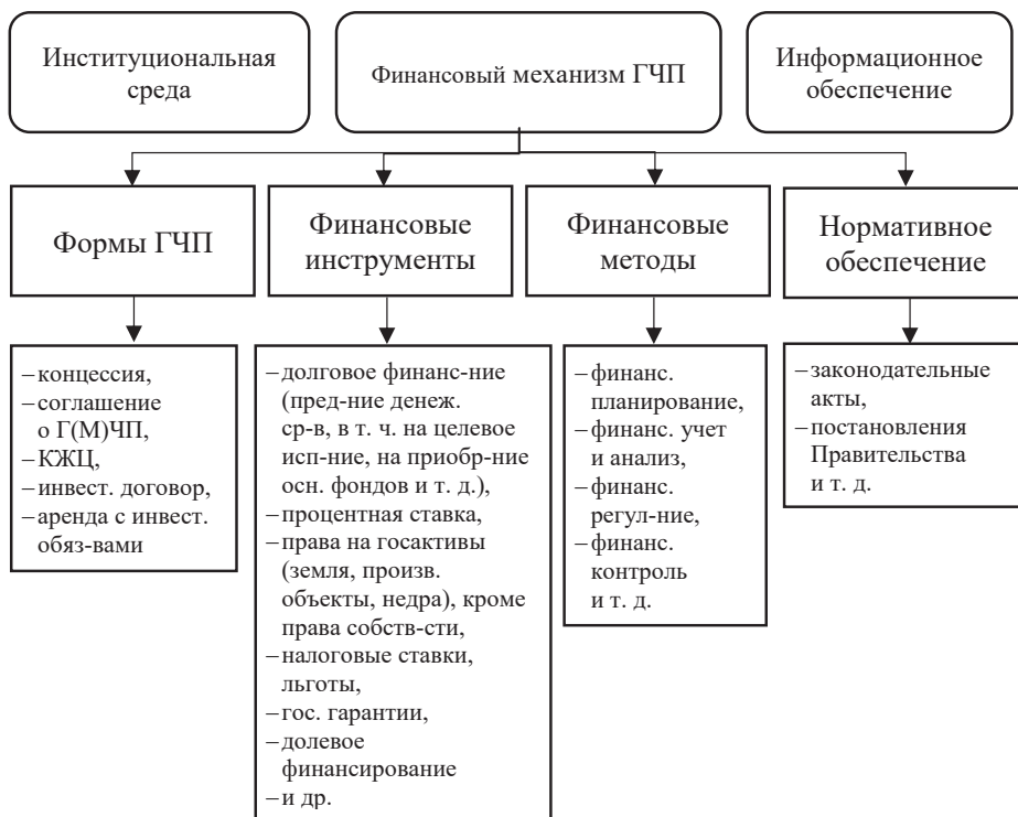
Рис. 3. Полная структура финансового механизма ГЧП с детализацией влияния структурных элементов

Успешное формирование и реализация финансового механизма ГЧП не могут быть осуществлены без развитой институциональной среды. В рамках реализации проектов ГЧП институциональная среда — «внешнее поле», через которое происходит взаимодействие различных правовых и финансовых институтов, способствующих своей деятельностью реализации финансовых механизмов в рамках проектов ГЧП. Такое взаимодействие может осуществляться в форме инвестиционного проекта или проведения независимой оценки деятельности ГЧП. Авторами предлагается более широкая структура финансового механизма ГЧП, включающая в себя влияние внешних факторов (рис. 3).