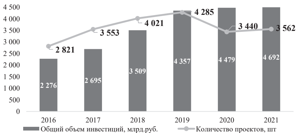
Рис. 1. Рынок инфраструктурных инвестиций в России (накопительным итогом)