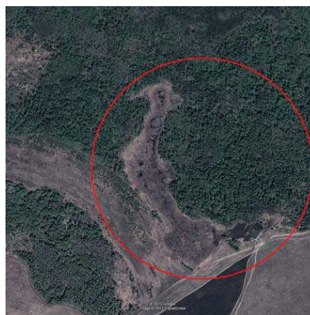
Рис. 1. Сравнение космических снимков до начала фонтанирования скважины (а — Corona, 6.18.1967) и в настоящее время (б — GeoEye, 5.27.2011)