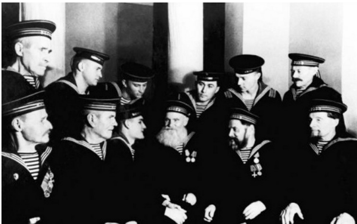
Рис. 1. Ветераны «Варяга» с молодыми моряками в 50-ю годовщину со дня подвига русских моряков в сражении в бухте Чемульпо. Москва, 1954 г.