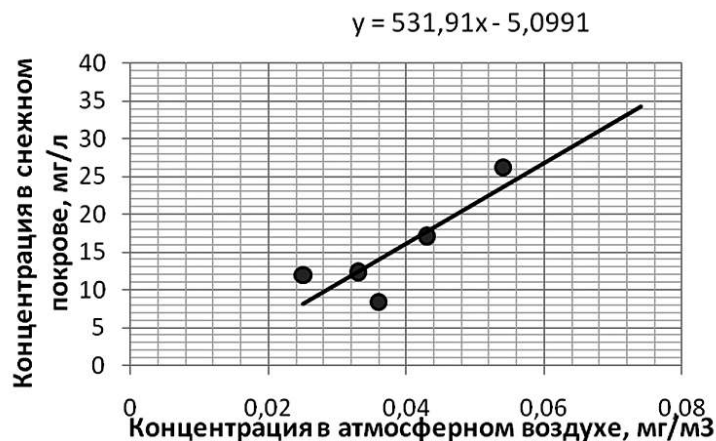
Рис. 1. Корреляционное поле зависимости «оксиды азота в воздухе — нитрат-ионы в снежном покрове»

Анализ парной корреляции «данные снежного мониторинга — данные стационарных постов» по данным за зимний период 2011-2012 гг. показал, что наибольшая зависимость наблюдается по оксидам азота, коэффициент корреляции для которых r = 0,85 . Согласно критериям оценок зависимостей наблюдается сильная положительная зависимость, т.е. увеличение нитрат-ионов в снежном покрове напрямую связано с увеличением оксидов азота в атмосферном воздухе города. На рисунке 1 представлено корреляционное поле зависимости «оксиды азота в воздухе — нитрат-ионы в снежном покрове».