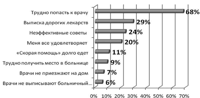
Рис. 2. Причины неудовлетворенности системой государственного медицинского обслуживания (в % от опрошенных, n=3054, 2013 г.)

Во-вторых, дефицит и неоптимальная структура медицинских кадров, что проявляется как в недостатке профессионалов здравоохранения по количественному критерию, так и в претензиях к квалификации отдельных специалистов, являются критерием, характеризующим качество оказания медицинской помощи . В-третьих, низкая степень обеспеченности и неэффективность использования материально-технической базы. Триада этих взаимосвязанных причин по сути предопределяет и все прочие проблемы. Например, основными причинами неудовлетворенности государственным медицинским обслуживанием 68% опрошенного населения отмечают трудность доступа к врачу, наличие больших очередей (что, несомненно, связано с дефицитом и неоптимальной структурой медицинских кадров); 29% респондентов не удовлетворены выпиской дорогостоящих и труднодоступных лекарственных препаратов; а 24% — выпиской неэффективных рецептов и рекомендаций, которые редко помогают (см. рис. 2).