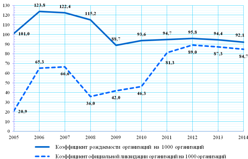
Рис. 1. Показатели демографии в целом по Российской Федерации [9]

Так, например, в 2014 году коэффициент рождаемости — то есть отношение количества зарегистрированных организаций за отчетный период к среднему количеству организаций, учтенных в Статистическом регистре за отчетный период, рассчитанное на 1000 организаций [9] — в целом по Российской Федерации составил 92,1. А коэффициент официальной ликвидации — т. е. отношение количества официально ликвидированных организаций за отчетный период к среднему количеству организаций, учтенных в Статистическом регистре за отчетный период, рассчитанное на 1000 организаций — в свою очередь равен 84,7 в целом для Российской Федерации (см. рисунок 1).