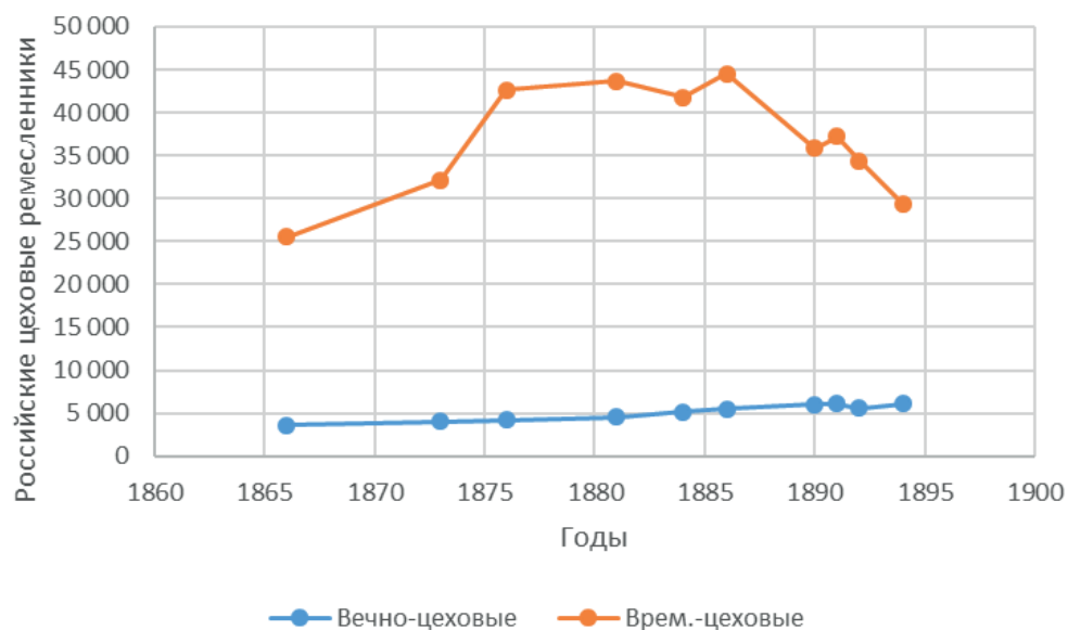
Рис. 2. Вечно- и временно-цеховые российские цехов Санкт-Петербурга, 1866-1919 гг. Источник: [15, с. 403]