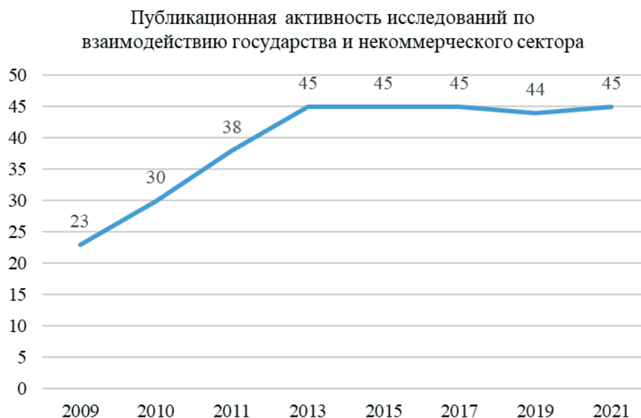
Рис. 1. Публикационная активность по проблемам взаимодействия государства и некоммерческого сектора

Количество научных работ в других странах не превышает 15 статей. Российские ученые в данной предметной области имеют 12 публикаций (1,5%), 8 из которых приходится на исследователей НИУ ВШЭ.