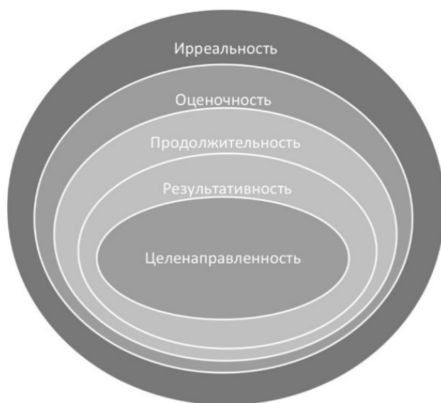
Рис. 1. Признаки зрительного восприятия Fig. 1. Features of visual perception